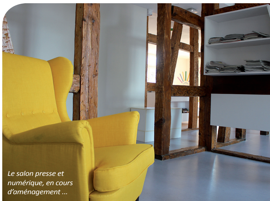
Le salon presse et numérique, en cours d'aménagement ...