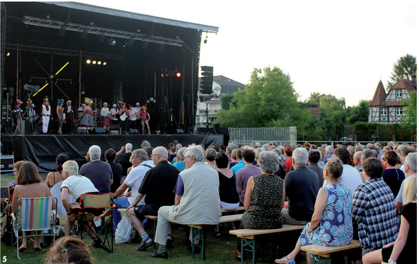
1 & 2 Remise de dictionnaires le 29 juin par les membres de la municipalité aux élèves des classes de CM2 des écoles de Fegersheim et d'Ohnheim. 3. Concert intimiste proposé par le duo d'artistes « les Belettes », le 30 juin au Caveau. 4. Dernière séance des nouvelles activités pédagogiques (NAP) le 6 juillet, avant les vacances d'été. 5. La 31 e tournée d'été de la choucrouterie, un spectacle plein air gratuit organisé à Fegersheim le 7 juillet.