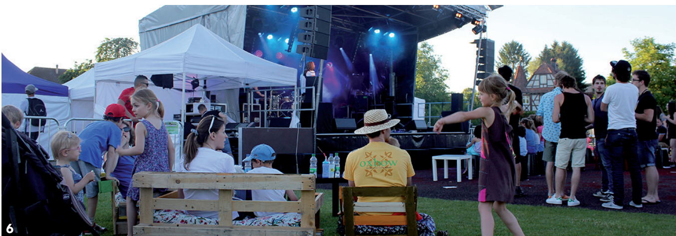
1. Les enfants des écoles élémentaires rassemblés au Jardin des deux rives le 15 mai pour l'opération « KM solidarité ». 2. Soirée guinguette le 19 mai au Caveau avec le groupe « Les Escrocs du swing ». 3. Stand de vente de livres de la bibliothèque au marché aux puces de l'AFF, le 21 mai. 4. « C'était un petit matelot », spectacle jeune public proposé gratuitement au Caveau le 7 juin. 5. Visite du Square, le 10 juin, à l'issue d'une réunion de travail sur la question du logement locatif, en présence notamment des bailleurs sociaux Domial et Habitation Moderne. 6. 9 e édition du Feg'stival sous le soleil, les 9 et 10 juin, avec la participation de l'école municipale de musique et de danse, d'une cinquantaine de bénévoles, de l'association des jeunes engagés de Fegersheim, des membres du Conseil municipal, d'exposants à l'éco-village et de groupes de musique.