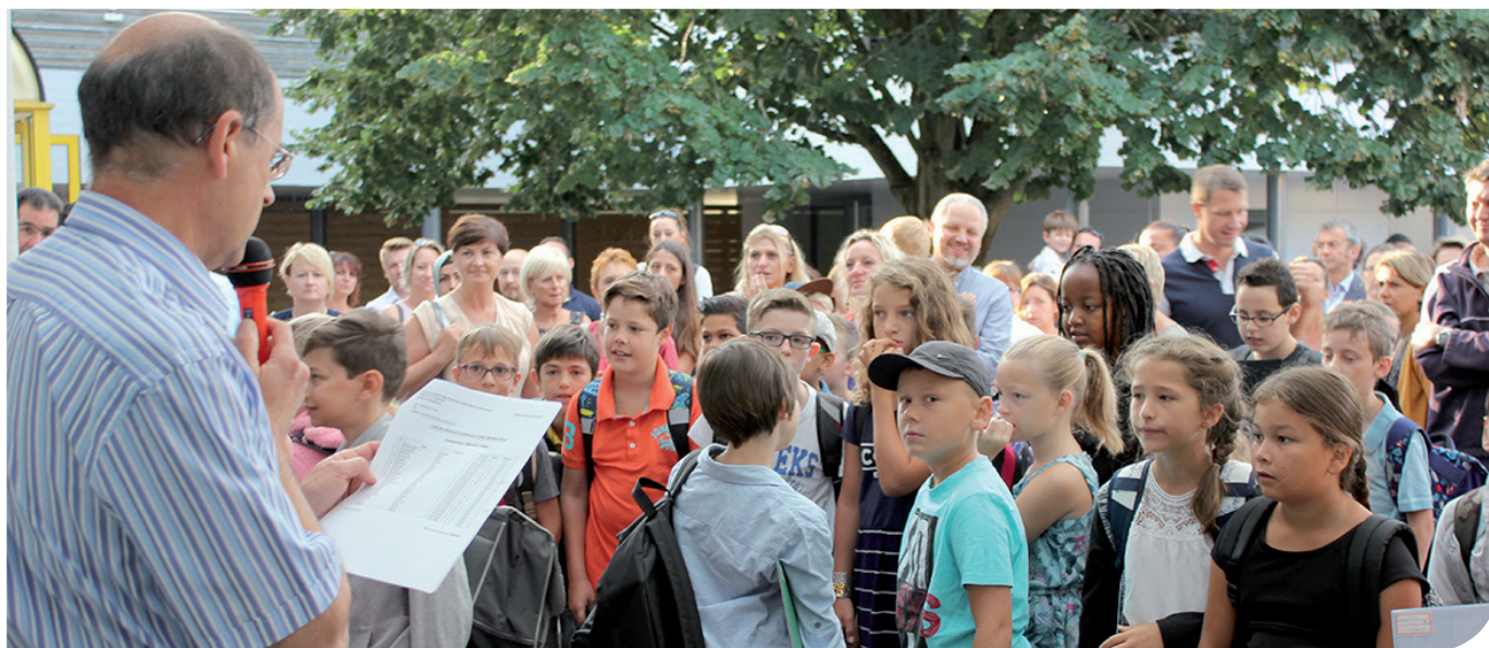
Appel des élèves le jour de la rentrée scolaire 2016/2017 à l'école élémentaire d'Ohnheim.