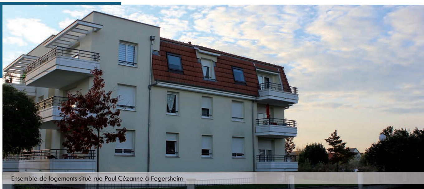
Ensemble de logements situé rue Paul Cézanne à Fegersheim

Une présentation détaillée sera publiée dans le Relais annuel du mois de janvier 2015.