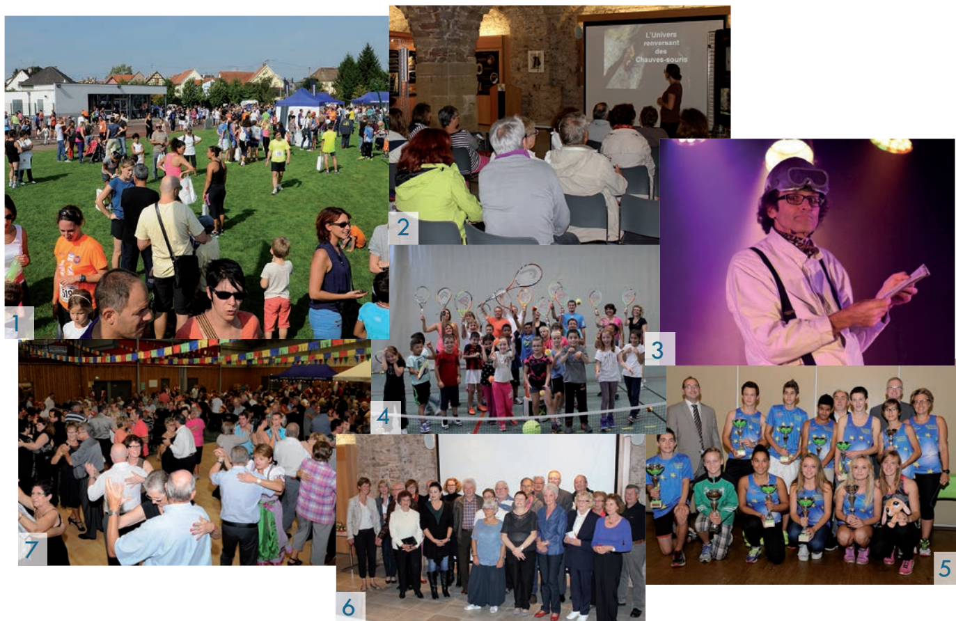
1. 6 e édition des Foulées de Fegersheim le 7 septembre avec plus de 800 participants / 2. «Le monde merveilleux des chauves-souris» en septembre au Caveau / 3. Plongeon dans le monde érotico-cosmique du Capitaine Sprütz, le 12 septembre / 4. Participation des école élémentaires à la Fête du sport le 19 septembre / 5. Fegersheim athlétisme récompensé lors de la cérémonie des lauréats le 20 septembre / 6. Les participants du Concours des maisons fleuries honorés par la commune le 10 octobre / 7. Belle affluence à la 28 e édition de la soirée Baeckeofe, le 18 octobre