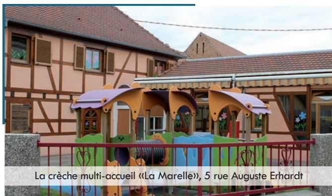
La crèche multi-accueil «La Marelle», 5 rue Auguste Erhardt

Au 31 décembre 2013, selon la CAF du Bas-Rhin, il y avait à Fegersheim-Ohnheim 342 enfants de moins de six ans, dont 169 de moins de trois ans. Pour assurer leur prise en charge dans de bonnes conditions, pendant que leurs parents travaillent, il existe sur Fegersheim 3 structures dédiées à la petite enfance: un multi-accueil, une micro-crèche, et un relais assistants maternels (RAM) intercommunal. Ces dispositifs sont dirigés par une directrice, éducatrice de jeunes enfants.