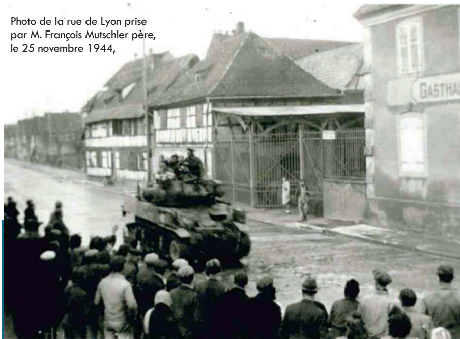
Photo de la rue de Lyon prise par M. François Mutschler père, le 25 novembre 1944,

« (...) Après une nuit calme, le samedi 25 novembre, la nouvelle fuse : des blindés arrivent du côté de Geispolsheim. Du haut du séchoir Meyer, on aperçoit distinctement sur la départementale de Geispolsheim à Lipsheim une dizaine de chars, d'engins, de véhicules d'apparence différente des blindés allemands. (...) Un quart d'heure plus tard, le premier char sort du virage et bientôt arrive à notre hauteur. Je me présente au chef de char pour le mettre en garde contre les défenses établies à la sortie nord. « Ont-ils des bazookas? » est sa question. Je ne sais que répondre, ce mot m'étant inconnu. Panzerfaust ? Là, je peux acquiescer, mais j'ai des difficultés à trouver les mots français, n'ayant plus utilisé notre langue pendant quatre ans. (...)»