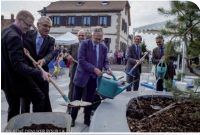
14 septembre : inauguration du pôle multimodal de Lipsheim/Fegersheim.