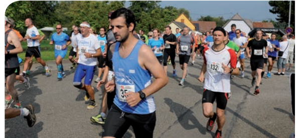
7 septembre : au programme des Foulées de Fegersheim, pour la 7 e édition, les participants ont pu courir les 1,5km, les 5km, les 10km, avec une nouveauté cette année qui a marqué les esprits : la marche nordique.