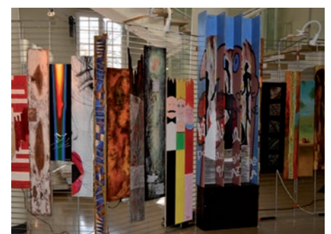
Exposition 2014 au pavillon Joséphine du parc de l'Orangerie