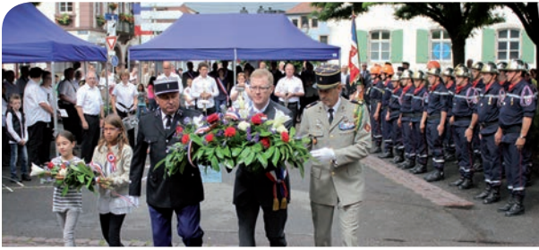
14 juillet : cérémonie avec l'Harmonie, les Pompiers, les Anciens Combattants, le Conseil Municipal des Enfants... Et hommage à Olympe de Gouges, auteure de la 1 ère déclaration des droits de la femme.

25 juillet : équipés comme des professionnels, les jeunes apprentis apiculteurs ont pu approcher les ruches situées en face du centre sportif et culturel et ont récolté 56,5kg de miel.