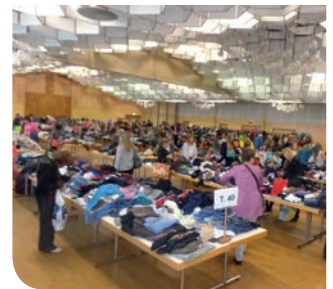
la bourse aux vêtements du mois de septembre 2014