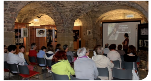
5 septembre : conférence dans le cadre de l'exposition "les ailes de la nuit".