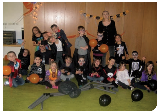
le grand bal d'Halloween pendant les vacances de la Toussaint

Contact : Corina GERBER, responsable 06 65 13 28 38 / pot-city@opal67.org