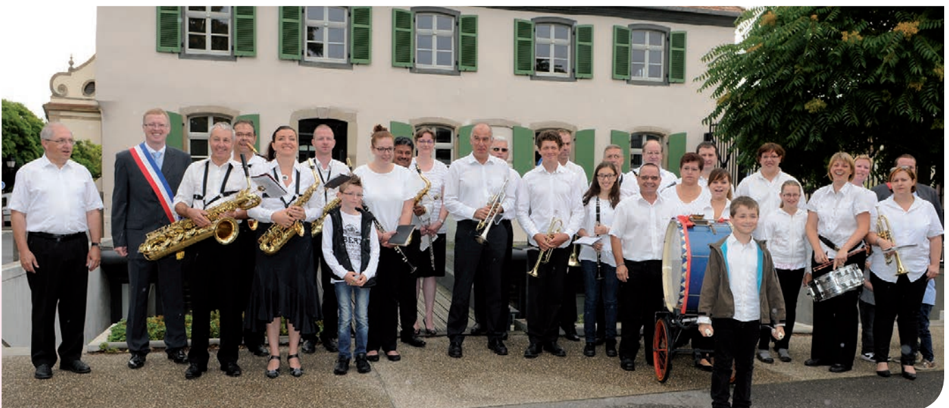
Les musiciens rassemblés à l'occasion des festivités du 14 juillet 2014