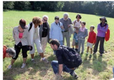
10 septembre : lors d'une sortie d'exploration, les habitants ont pu découvrir ou redécouvrir la faune et la flore du territoire.