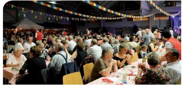
18 octobre : 28 e édition de la traditionnelle soirée Baeckeofe.