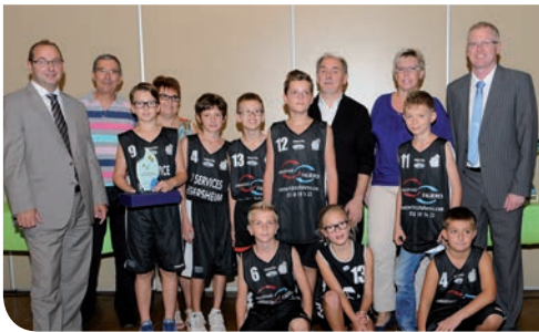
20 septembre : remise de récompenses aux sportifs méritants