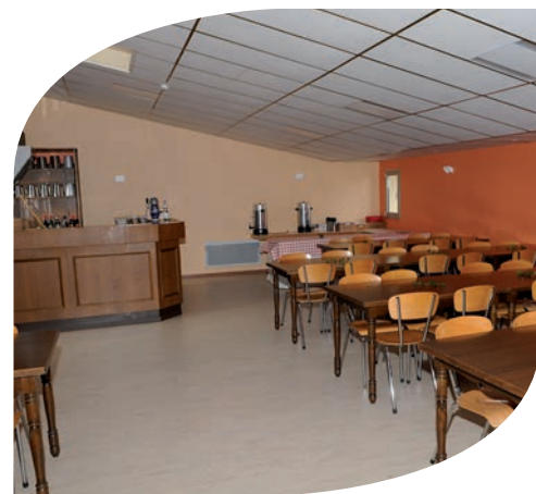
Le nouveau visage du bar champagne, rénové du sol au plafond en passant par les murs et le système d'éclairage.

En vue de la rénovation du système de chauffage et de ventilation du centre sportif et culturel, différents travaux seront réalisés. La mise en conformité de l'éclairage des terrains de football, l'éclairage des parkings avant et arrière du bâtiment seront également au cœur des préoccupations de la municipalité. L'étude sur le besoin de nouveaux vestiaires à proximité du terrain de football rentrera dans la phase de concertation avec les acteurs concernés. Enfin, les animations et les événements seront reconduits.