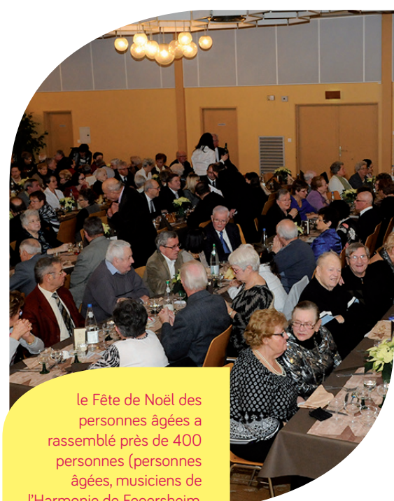
Le Fête de Noël des personnes âgées a rassemblé près de 400 personnes (personnes âgées, musiciens de l'Harmonie de Fegersheim, personnel de service...)

Pour l'année 2015, la commission a pour projets de mettre en place un Conseil des aînés, de mener une réflexion sur le pôle petite enfance et de poursuivre son travail avec les bailleurs sociaux