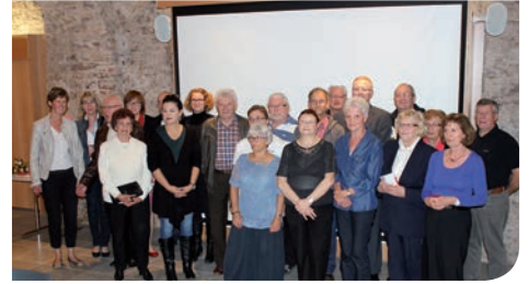
10 octobre : cérémonie de remise de récompenses aux participants du concours "les maisons fleuries"; une incitation à la biodiversité.