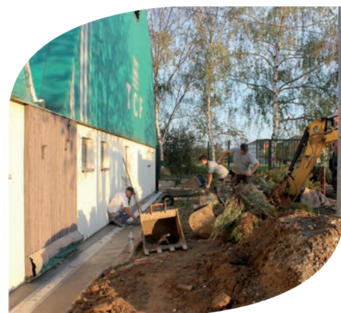
Travaux d'amélioration sur le système d'écoulement devant les courts de tennis.