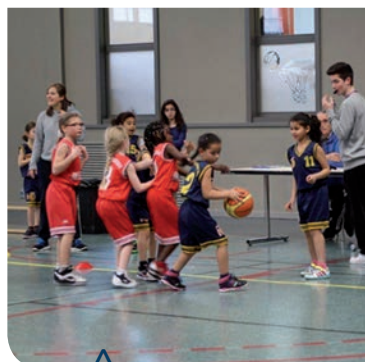
tournoi des mini-poussines