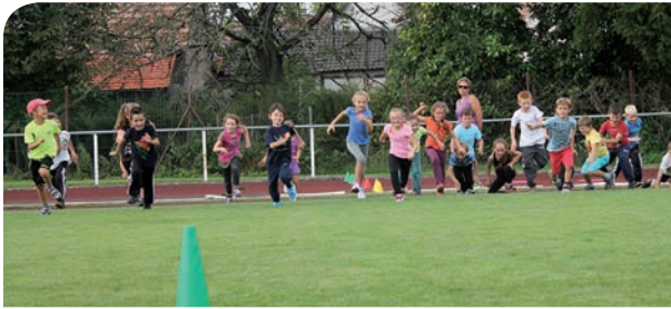
19 septembre : la fête du sport proposée aux enfants de la commune dans le cadre du temps scolaire.