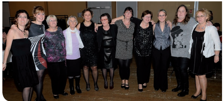
l'équipe de l'AFF lors de la soirée dansante du 22 novembre 2014