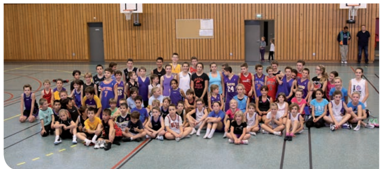
stade des jeunes