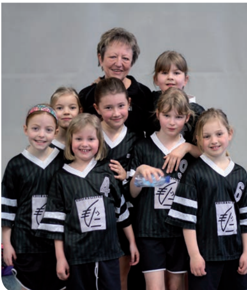
tournoi des mini-poussines

Contact : Marie-Luce LAHEURTE, Présidente 03 88 64 06 75 cmllaheurte@free.fr