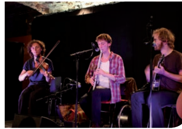
24 octobre : sonorités irlandaises avec le groupe "A spurious Tale" au Caveau.