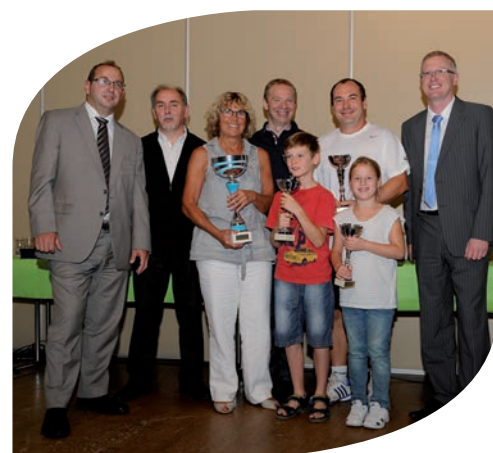
Photo de groupe lors de la cérémonie des sportifs méritants.